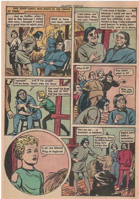
Mellem hæftets side 28 og 29.