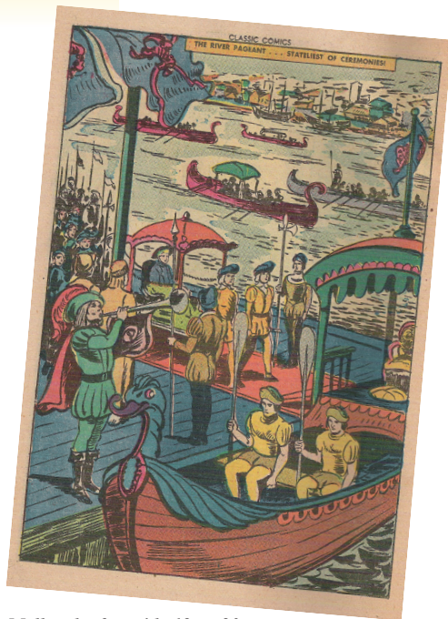
Mellem hæftets side 19 og 20.

Selvom Hicks har tegnet indholdet til begge, er historien til den norske udgave ligeledes redigeret i forhold til den oprindelige. Fyrsten og tiggeren er på 46 sider. Den amerikanske fra 1946 var på 53 sider. De manglende syv sider er vist her med angivelse af, hvor de hører hjemme i historien.