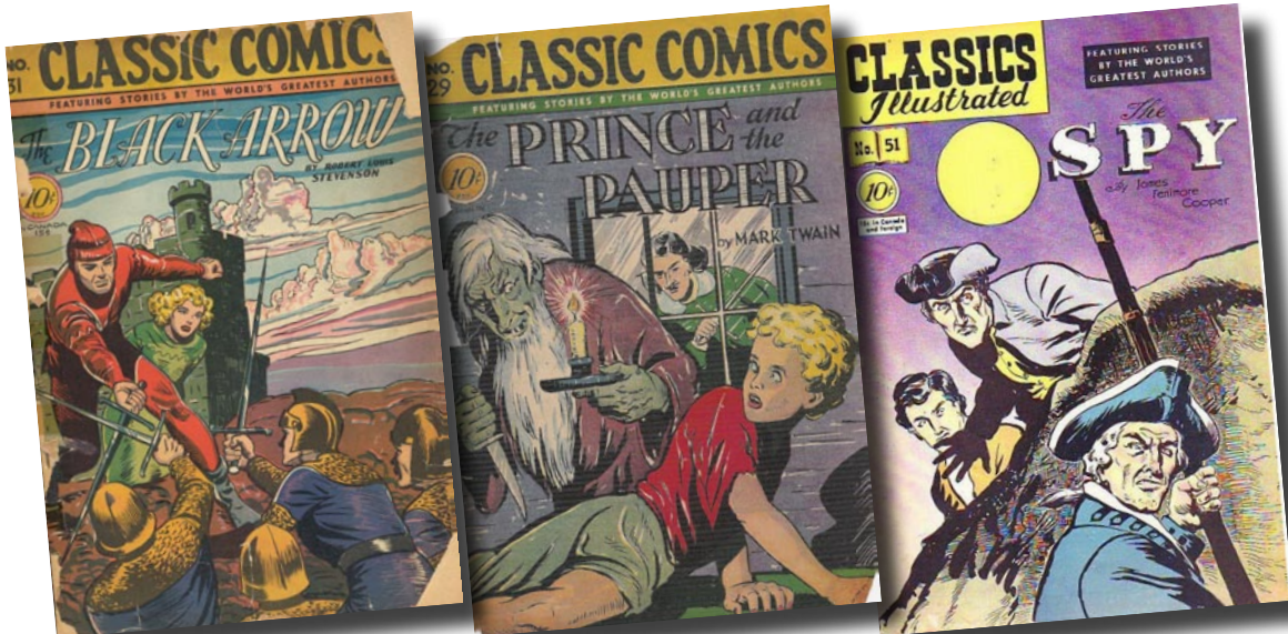
Ovenstående tre titler udkom alle i Norge med Hicks' version. Black Arrow og The Prince and the Pauper dog reduceret fra 56 siders hæfte til 48 sider. Nedenstående bidrag til Classic Comics nr. 21 udkom aldrig i Norge.