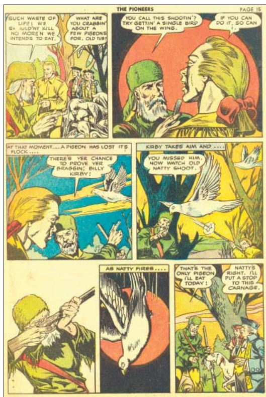
Forløbet herover, der starter øverst til venstre på foregående side, viser siderne 12-15 i den oprindelige 51 siders Classics Illustrated-version.

udkom i nye oplag. Et eksempel på dette er #37, The Pioneers , det norske Illustrerte Klassikere nr. 70.