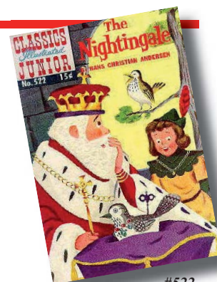
#522, H.C.Andersens The Nightingale , med forside og indhold tegnet af Dik Browne udkom aldrig på dansk. Til gengæld udkom #577 først i USA 6 år efter den danske udgave (nr.83).

Nr. 115-132 udgives som Pellefant & Co. Alle disse er svensk producerede.