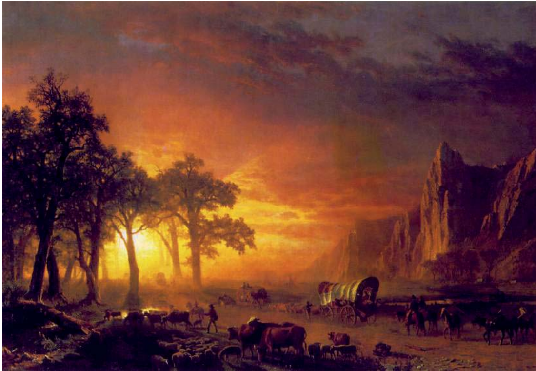
Albert Bierstadts maleri The Oregon Trail fra 1867.

Parkman var også aktiv som skribent i samtidens tidsskrifter. Mens han arbejdede på bogen Montecalm and Wolf (1884), skrev han bl.a. flere artikler til North American Review , hvor han argumenterede heftigt imod stemmeret til kvinder og almindelig stemmeret til mænd. Han mente det sted mod naturens love og historien. Han skrev også om slaveriet, som han principielt ikke var modstander af. Han mente, den historiske udvikling gjorde slaveri uhensigtsmæssigt, og at kun magtanvendelse ville forhindre eller udsætte slaveriets afskaffelse.