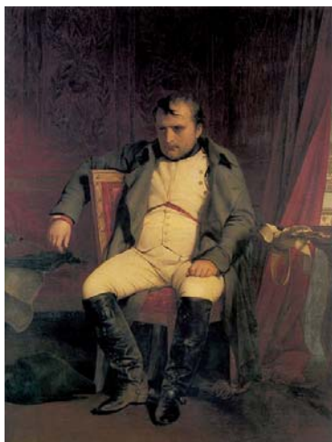
Paul Delaroche (1797-1859) maleri "Napoleon à Fontainebleau, le 31 mars 1814" viser en slagen kejser kort før abdikationen 6. april 1814.

Men kejser Napoleon var ingen fredens mand. Hans aggressive og ambitiøse udenrigspolitik udløste snart nye krige med Frankrigs