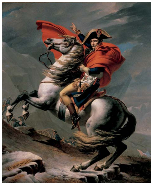
"Napoleon ved St. Bernard Pass" malet 1801 af franskmænden Jacques-Louis David.

Samtiden hyldede teamet fra Alsace-Lorraine som nogle af Frankrigs bedste forfattere, og kun Émile Zola kunne matche deres salgstal. Men ved indgangen til 1900-tallet svandt deres berømmelse, og i dag kendes