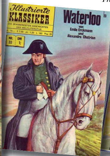
Fra venstre: Den amerikanske førsteudgave, en tysk udgave og den danske Stjerneklassiker.