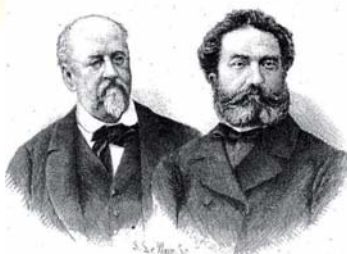
Émile Erckmann og Alexandre Chatrian