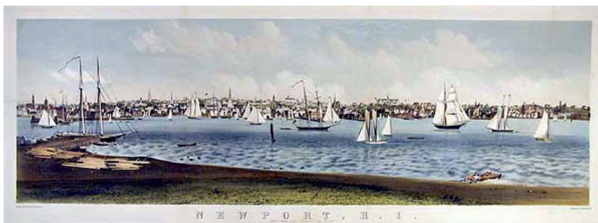
J. P. Newells maleri fra 1860 viser havnen i Newport set fra Fort Wolcott på Goat Island - 100 år efter de begivenheder, der udspiller sig i Den Røde Pirat .

De historier, lader vi ligge her, og lader i stedet tårnet være udgangspunkt for en hændelse til søs, mens 7-årskrigen udspandt sig i Europa og det nordamerikanske fastland.