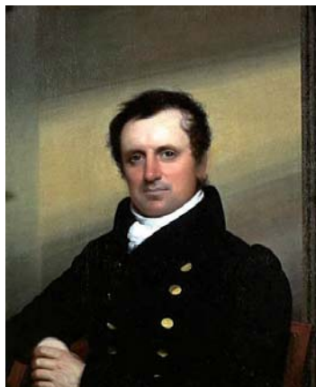
Forfatteren James Fenimore Cooper malet af John Wesley Jarvis 1822

Maleri fra ca. 1850 af Junius Brutus Stearns viser den unge George Washington i spidsen for engelsk-amerikanske styrker i slaget ved Monongahela i 1758.