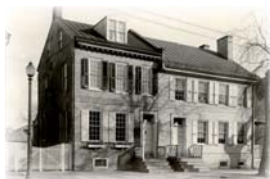
Coopers fødehjem i Burlington