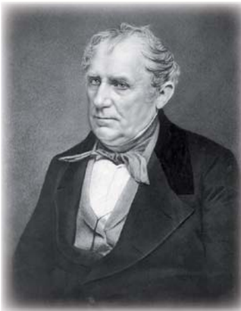
James Fenimore Cooper fotograferet 1850

Navnet Cooper er næsten synonymt med begrebet indianerromaner. Titler som Hjortedræber , Stifinder , Den sidste Mohikaner , Læderstrømpe og Prærien . Men bag dem gemmer sig en forfatter, som gennemløst spændte videre end som så, selvom han tidsmæssigt begrænsede sine romaner til en snæver historisk periode.