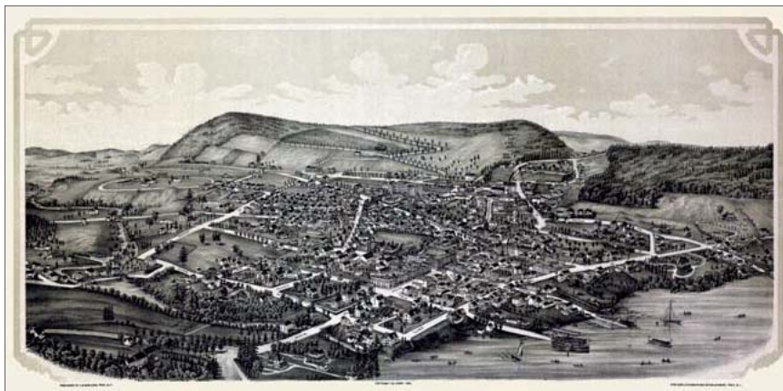
Prospekt over Cooperstown 1890