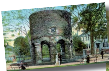
Newport Old Mill Tower. Herover som postkortmotiv fra starten af 1900-tallet. Til højre som motiv for maleri ca. 100 år tidligere.