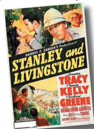
I 1938 instruerede Henry Kings Spencer Tracy som Stanley og Cedric Hardwicke som Livingstone.