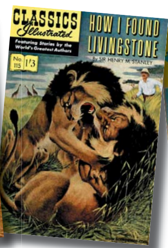
... og den engelske!