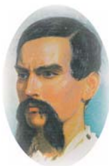
Richard Francis Burton

Flere ekspeditioner drog mod syd ad Den Hvide Nil, men først i 1858 nærmede man sig en løsning. Her nåede den engelske opdagelsesrejsende John Hanning Speke frem til den sydlige bred af en stor sø, som han gav navnet Victoria-søen efter den regerende britiske dronning. Speke havde som mål sammen med Richard Francis Burton at udforske de store søer i Centralafrika. Da han så ud over den enorme Victoria-sø, var han overbevist om, at her stod han foran Den Hvide Nils kilde.