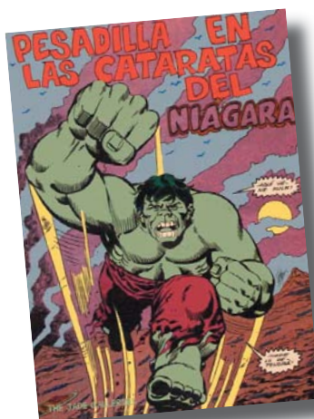
Hulk tegnet af Herb Trimpe og rentegnet af Sal Trapani.

Tegninger: Sal Trapani og Sal Finocchiaro