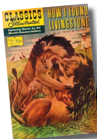
Den amerikanske udgave ...