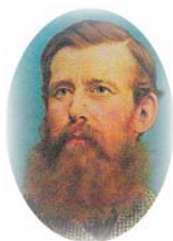
John Hanning Speke

Man vidste, at Nilens to grene, Den Hvide Nil fra syd og Den Blå Nil fra øst, løb sammen i Jartún i Sudan til en flod på sin vej mod Middelhavet. I 1770'erne forestod den skotske opdagelsesrejsende James Bruce en ekspedition, som bragte ham fra Tanasøen i Ethiopien til Jartún. Dermed var Den Blå Nils udspring bevist. Men hvor havde Den Hvide Nil sit udspring?