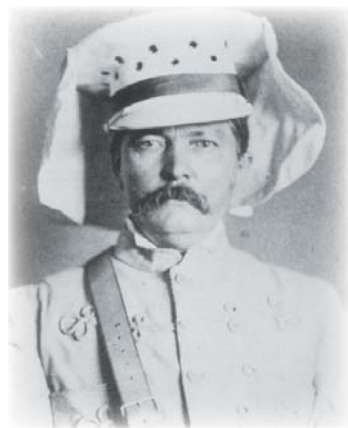
Henry M. Stanley udklædt som opdagelsesrejsende!

Stanley rejste til Zanzibar og udrustede en ekspedition med det bedste af alt det nødvendige. Det krævede