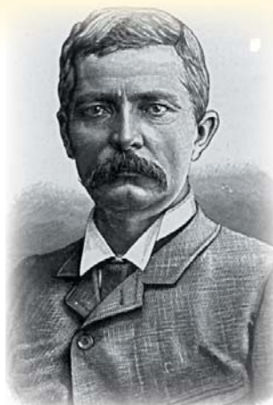
Henry Morton Stanley

Burton lå samtidig syg i en lejr ved Tanganyika-søen. Han blev rasende over Spekes skræslende påstand om at have fundet Nilens kilde, fordi han savnede et sikkert bevis.