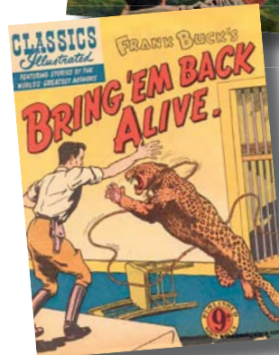
... og den australske