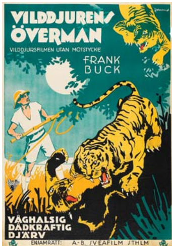
Svensk plakat for Jungle Cavalcade

I 1941 lød hans stemme på kommentatorsportet til Jungle Cavalcade , og i 1942 optrådte han som sig selv i den meget udokumentariske dokumentarfilm Jacaré , hvor Asien var udskiftet med Amazon-junglen. Til gengæld gjorde Tiger Fangs fra 1943 ikke forsøg på at være dokumentarisk, selvom Frank Buck også her optrådte som sig selv. Den handler om en storvildtjæger, der rejser til Malaya for at forhindre nazister og japanere i at ødelægge gummiindustrien! Måske var det her 1980'ernes tv-serie hentede sin inspiration. Så tidligt som i 1937 hav-