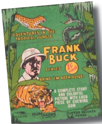
Herover: tyggegummi-papir fra 1938. Hvert stykke tyggegummi blev pakket ind sammen med et samlebillede med bagsidetekst baseret på Frank Bucks Bring 'em Back Alive . Herunder: tilsvarende vare fra 1950.