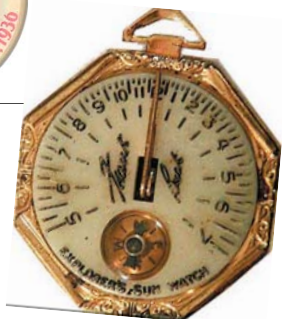
Frank Buck Explorer's Sun Watch - solur og kompas i et.