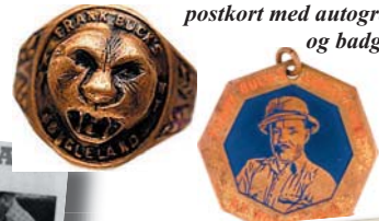
Herunder: Effekter fra Frank Buck's Jungletland ved New York World's Fair i 1938: Ring (handlet på auktion i 2006 for 2250 $), charm, plakat, postkort med autograf og badge.