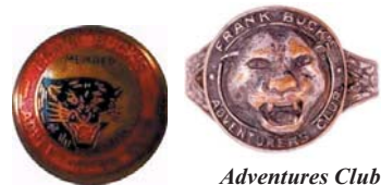
Adventures Club pin fra 1934 og ring fra 1938 - givet som præmier ved Pepsodents Frank Buck Radio-shows. Nu handles de til pæne priser blandt samlere.

Man behøver ikke være i tvivl om, at Frank Buck var bevidst om sin egen reklameværdi - både når det handlede om af sælge sig selv, egne eller andres produkter. Her er et lille udsnit af de mange Frank Buck-produkter, som samlere i dag er parate til at betale høje priser for. Produkter, som forretningsmanden Frank Buck satte i produktion som PR for sig selv, eller som andre betalte ham for at lægge navn til.