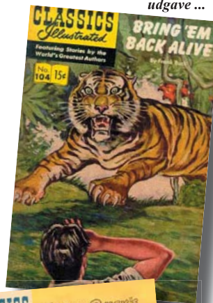
Den amerikanske udgave ...