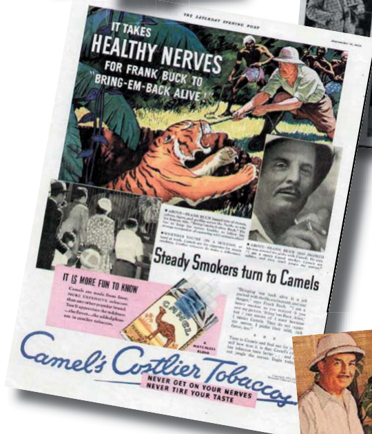
Som storryger reklamerede Frank Buck for Camel-cigaretter. I 1950 døde han af lungekræft. Måske skulle han have holdt sig til et glas whiskey i ny og næ!